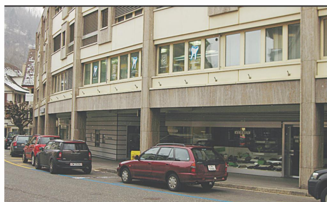
Poststrasse 5, Sarnen (Handelshof im 1. Stock) (im ehemals Credit Suisse-Gebäude)